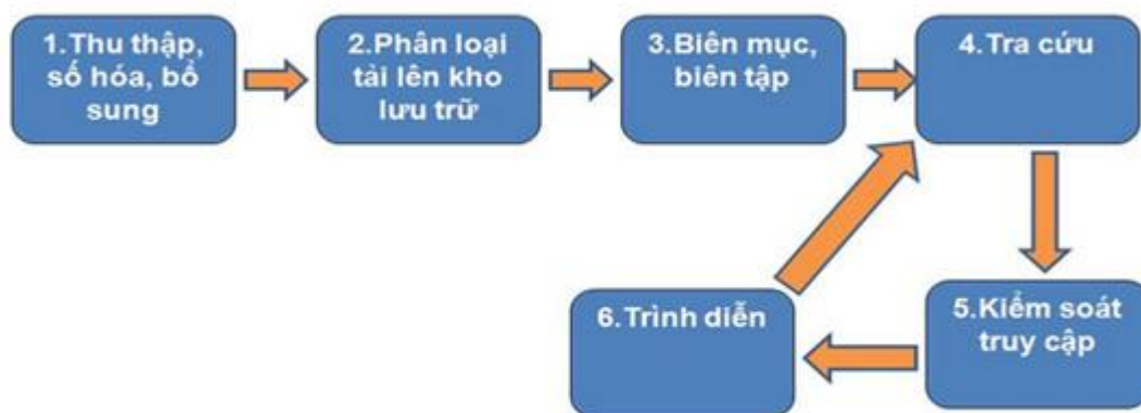
Hình 2. Quy trình quản lý tài liệu số

KIPOS.Digital cho phép quản lý một cách hiệu quả và tiện lợi các bộ sưu tập số với nhiều công đoạn nghiệp vụ khác nhau (Hình 2).