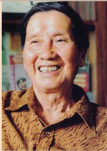
Nhạc sĩ Phạm Tuyên