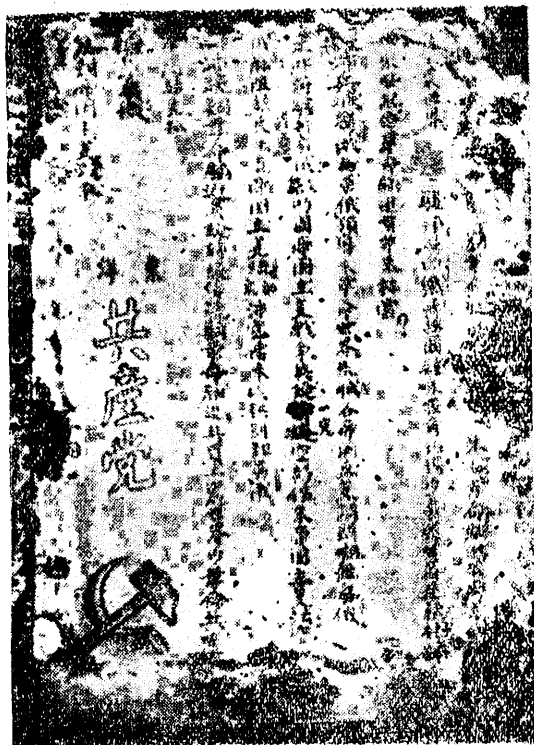
Ảnh số 1